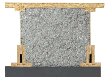
Bodenexpander BE mit Bodentasche BT