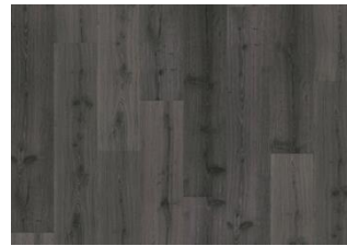
Didnok - 6 mm Rigid Click