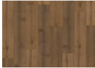
Takayna - 6 mm Rigid Click