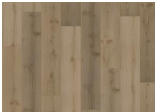
Foloi - 6 mm Rigid Click