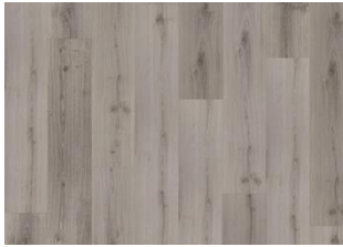
Otago - 6 mm Rigid Click