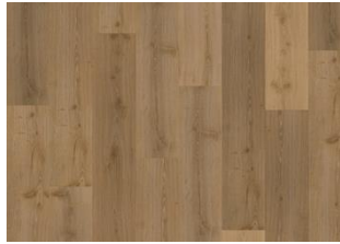
Akkelis - 6 mm Rigid Click