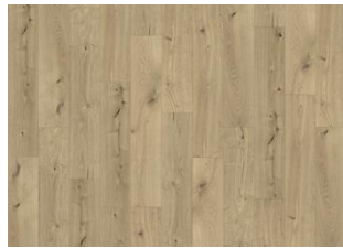
Coconino - 6 mm Rigid Click