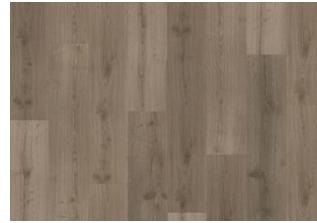
Blaiken - 6 mm Rigid Click