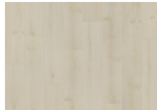
Irati - 6 mm Rigid Click