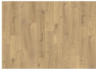
Thuringian - 6 mm Rigid Click