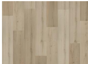
Kilsbergen - 6 mm Rigid Click