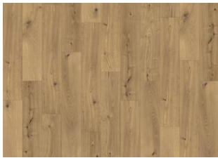
Moesgaard - 6 mm Rigid Click